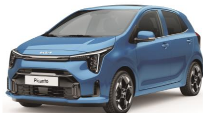
metalizowany Sporty Blue (SPB) antena dachowa czarna