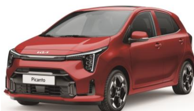
metalizowany Signal Red (BEG) antena dachowa w kolorze nadwozia