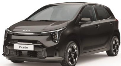
metalizowany Aurora Black (ABP) antena dachowa czarna bezpłatny