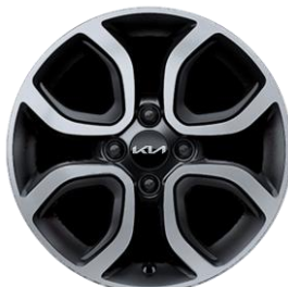
Business Line : 15" aluminiowe obrócze kół z oponami w rozmiarze 185 / 55 R15