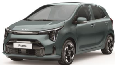
pastelowy Adventurous Green (A2G) antena dachowa w kolorze nadwozia