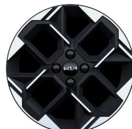
GT Line : 16" aluminiowe obrócze kół z oponami w rozmiarze 195 / 45 R16