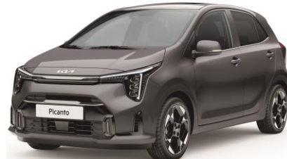
metalizowany Astro Grey (M7G) antena dachowa czarna