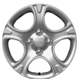
L : 14" stalowe obręcze kół z oponami w rozmiarze 175 / 65 R14