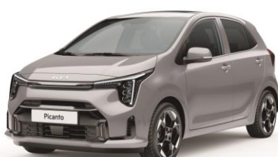
metalizowany Sparkling Silver (KCS) antena dachowa czarna