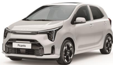
pastelowy Clear White (UD) antena dachowa czarna