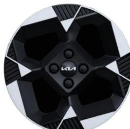
Business Line (opcja A16) 16" aluminiowe obręcze kół z oponami w rozmiarze 195 / 45 R16