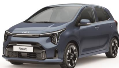
metalizowany Smoke Blue (EU3) antena dachowa czarna