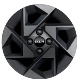
L (opcja A14) : 14" aluminiowe obrócze kół z oponami w rozmiarze 175 / 65 R14