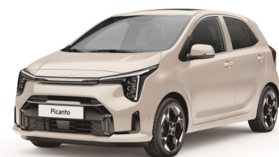
metalizowany Milky Beige (M9Y) antena dachowa w kolorze nadwozia