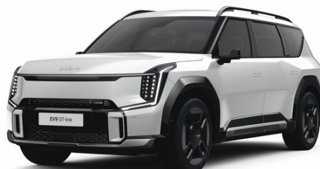
Snow White (SWP) metalizowany