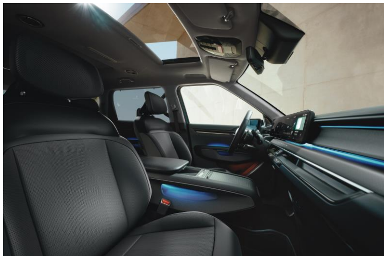
Wersja Earth wnętrze RBQ