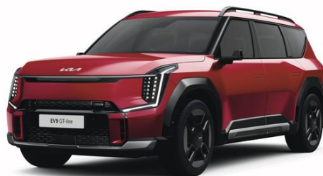
Flare Red (C7R) metalizowany, niedostępny z tapicerką NJR, lakier bez dopłaty