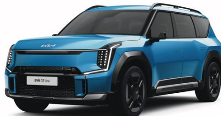
Ocean Blue (OBG) metalizowany, niedostępny dla Earth