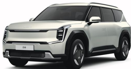
Ivory Silver (ISM) matowy, niedostępny dla GT-Line