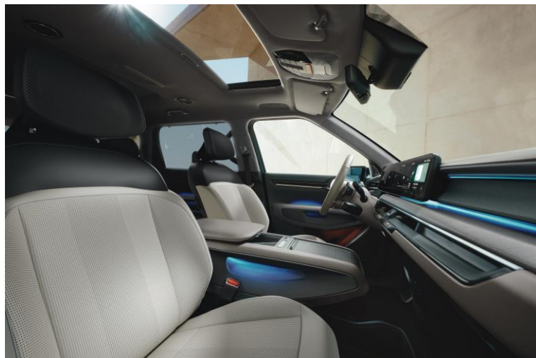
Wersja Earth wnętrze EMA