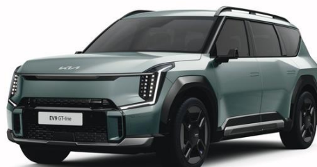
Iceberg Green (IEG) metalizowany